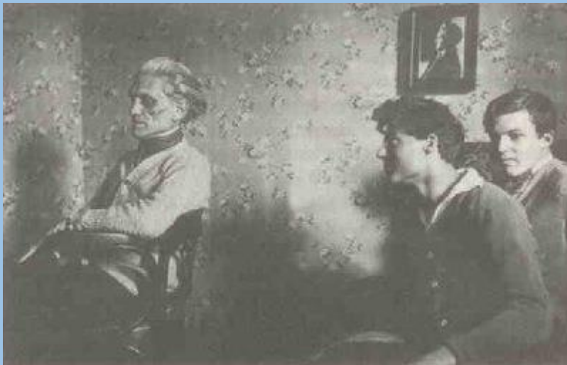
Claus und Berthold mit dem Dichter Stefan George im November 1924

Noch während seiner Gymnasialzeit erweckt bei Stauffenberg das Interesse an der Bündischen Jugendbewegung. Nach der 1920 erfolgten Ausrufung des „Bundes der Neupfadfinder“ tritt Claus dieser Organisation bei. 1923 kommt es zur ersten Begegnung der Stauffenberg-Brüder mit Stefan George (1868 – 1933), der seit der Jahrhundertwende der dominante Dichter in Deutschland ist. George ist geistiger Schöpfer einer Bewegung des „Neuen Reiches“ und einer konservativen Revolution. Der „George-Kreis“ fördert die Heranbildung einer jungen Elite zur Schaffung einer neuen Ordnung. Die Gedankenwelt des Dichters strahlt offenbar eine große Anziehungskraft auf den jungen Stauffenberg aus, der seinerseits zusammen mit seinen Brüdern auch einen bleibenden Eindruck bei George hinterlässt. Berthold, Alexander und Claus zählen für George zweifellos zum Kreis jener Elite, denen er die Gestaltung der Zukunft Deutschlands zutraut. Von seinen Anhängern wird der Dichter ehrfurchtsvoll mit ›Meister‹ angeredet. Dies alles geschieht in einer Zeit, in der allgemein der Wunsch nach einer neuen starken Nation, einem neuen starken Deutschland um sich greift, insbesondere vor dem Hintergrund, dass der Versailler Vertrag von vielen als über die Maßen demütigend für Deutschland empfunden wird.