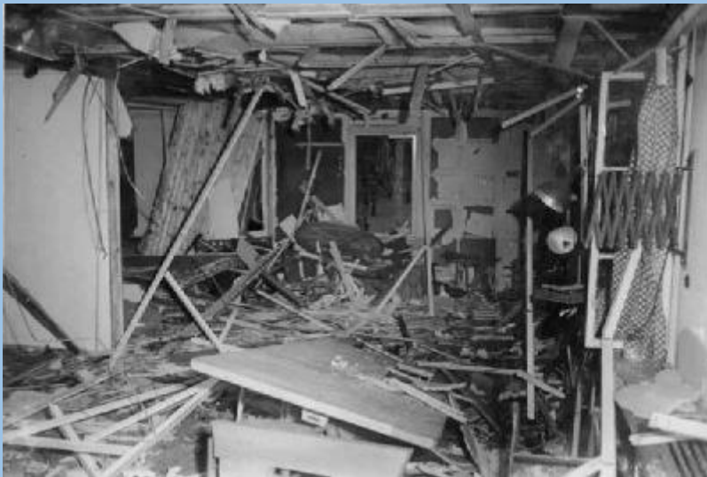
Der zerstörte Besprechungsraum in der sogenannten "Lagebaracke" nach der Explosion.

Die Geheime Staatspolizei wird später feststellen, dass die „HE 111“ mit Stauffenberg und Haeften „gegen 15:45 Uhr“ in Rangsdorf gelandet sei.