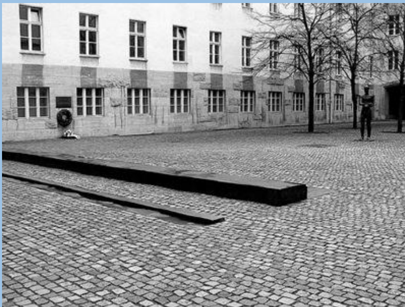
Das Ehrenmal im Innenhof des Bendlerblocks. Links an der Wand befindet sich die Gedenktafel an der Stelle, an der die vier Verschwörer in der Nacht vom 20. auf den 21. Juli 1944 ermordet wurden.

Fromm erklärt Mertz, Olbricht, Stauffenberg und Haeften für standgerichtlich zum Tode verurteilt. Stauffenberg erklärt, er trage allein die Verantwortung für alles Geschehene, die anderen hätten als Soldaten seine Befehle ausgeführt. Fromm sagt nichts und tritt an die Seite der Tür. Stauffenberg, Mertz, Olbricht und Haeften gehen an ihm vorbei, zögernd, werden in den Innenhof geführt und von einem Erschießungskommando kurz nach Mitternacht einzeln nacheinander vor einem Sandhaufen an der Mauer des Gebäudes erschossen. Als Stauffenberg vor dem Sandhaufen steht, ruft er laut, ehe er erschossen wird: „Es lebe das geheiligte Deutschland!“