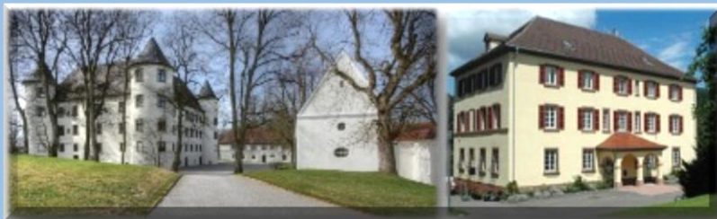
Das Schloss in Jettingen (links), in dem Stauffenberg zur Welt kam und das Schloss in Lautlingen, dem späteren Hauptsitz der Familie, in dem die Mutter Caroline Gräfin Stauffenberg während der

Die Schlösser Jettingen und Greifenstein, später auch das in Lautlingen und der Stuttgarter Hof des Königs von Württemberg geben uns einen Hinweis auf Stauffenbergs Herkunft. Die Familie entstammt einem aus der schwäbischen und fränkischen Ritterschaft hervorgegangenen uralten Adelsgeschlecht, dessen Ursprünge im schweizerischen Kyburg liegen und das im 13. Jahrhundert als Ministeriale (Mundschenken) in die Dienste der Grafen von Zollern eingetreten war. Ganz in der Nähe der Burg Hohenzollern befinden sich im heutigen Hechinger Stadtteil Stein die Überreste der im 16. Jahrhundert abgegangenen Stammburg der Stauffenbergs.