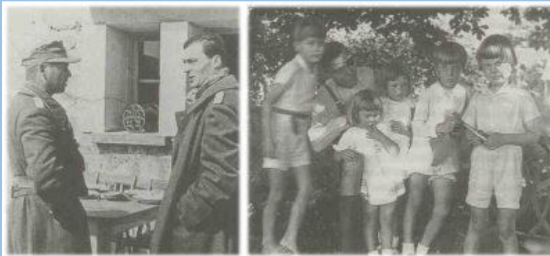
Bild links: Fronteinsatz in Afrika: Der Divisionskommandeur der 10. Panzer-Division, Generalmajor Freiherr von Broich, und sein erster Generalstabsoffizier (Ia), Oberst-leutnant i. G. Stauffenberg, am 20. Februar 1943 auf dem Gefechtsstand im Bahnhof Kasserine/Tunesien. Bild

Stauffenbergs Einsatz als 1. Generalstabsoffizier der 10. Panzerdivision endet am 7. April 1943 auf folgenschwere Weise. Während des Rückzuges werden Teile seiner Division von Jagdbombern angegriffen. Stauffenberg dirigiert die Bewegung der Fahrzeuge stehend in seinem Horch-Kübelwagen, als sein Wagen von vorne von einem Tiefflieger beschossen wird. Stauffenberg wirft sich aus dem Wagen auf den Boden, liegt mit dem Kopf auf den Händen und wird getroffen. Der Arzt einer fremden Einheit, der mit seinem Sanitätswagen zufällig vorbeikommt, leistet erste Hilfe und veranlasst den Transport zum Hauptverbandplatz. Von dort wird Claus Graf Stauffenberg ins Feldlazarett 200 nach Sfax an der tunesischen Küste gebracht. Stauffenberg ist sehr schwer verletzt. Die rechte Hand wird über dem Gelenk amputiert, der kleine und der Ringfinger der linken Hand und das linke Auge müssen ebenfalls amputiert werden. Am rechten Knie wird eine Streifschusswunde behandelt. Nach drei Tagen bringt ein Sanitätsauto Stauffenberg in das Kriegslazarett 950 nach Tunis-Carthago.