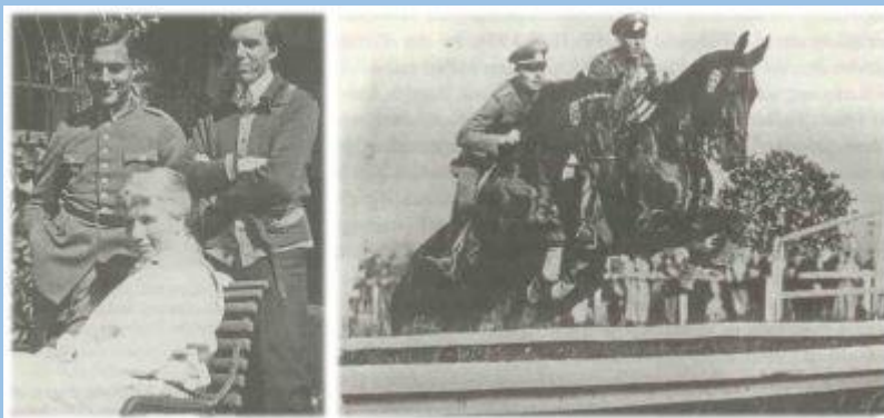
Bild links: Claus und Berthold bei ihrer Mutter Caroline Gräfin Stauffenberg in Lautlingen 1928 Bild rechts: Claus Graf Stauffenberg bei einem Reitturnier in Heiligenhaus 1935

Die Reichswehr ist beim Eintritt Stauffenbergs eine reine Freiwilligenarmee, deren Stärke durch den Versailler Vertrag auf 100.000 Mann begrenzt ist. Die Entscheidung für die Kavallerie fällt leicht angesichts seiner Liebe zu Pferden und seiner Begeisterung für das Reiten. Stauffenberg durchläuft die in jener Zeit übliche Offiziersausbildung, absolviert die Infanterie-Schule in Dresden (1928) und die Kavallerie-Schule in Hannover (1929), die er mit dem Ehrensäbel für besondere Leistungen abschließt, wird am 1. Januar 1930 Leutnant, nimmt danach an verschiedenen Speziallehrgängen teil und wird im August 1933 zum Oberleutnant befördert. Wenige Wochen zuvor hatten die Nationalsozialisten in Deutschland die Macht ergriffen und der bereits vom Alter geschwächte Reichspräsident von Hindenburg hatte Adolf Hitler zum Reichskanzler ernannt. Nicht allein der Name der Armee, in der Stauffenberg nun dient, hatte sich geändert, auch die Zweckbestimmung der Wehrmacht wurde nun grundlegend eine andere. Alles in Deutschland wurde anders.